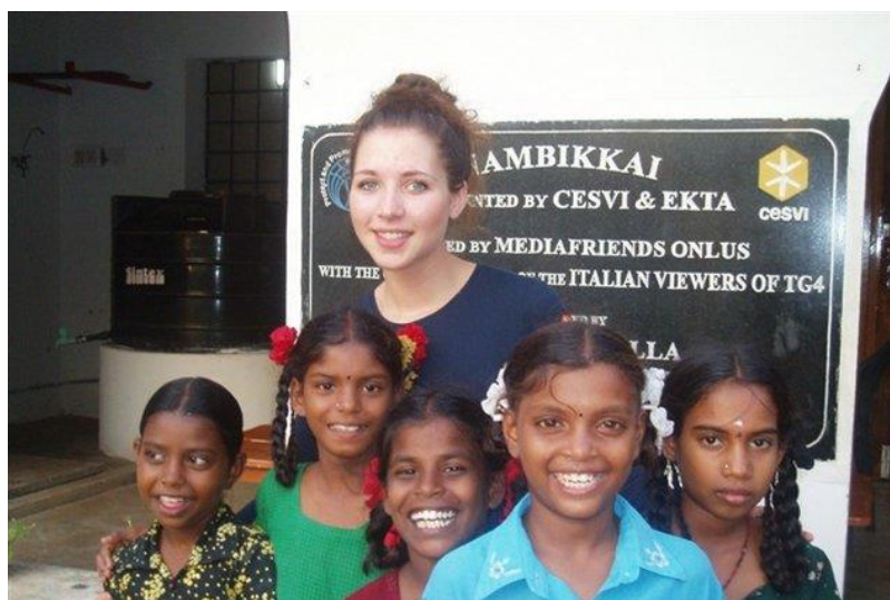
Volontaria Cesvi presso la casa del Sorriso di Nambikkai

Cesvi invia nelle Case del Sorriso i propri volontari . La maggior parte di essi rimangono con i bambini per circa un mese, mettendo a disposizione le loro competenze: alcuni volontari insegnano inglese , altri l' artigianato , altri ancora la musica , la danza , il disegno . Il contributo dei volontari è fondamentale per sostenere la positività nei bambini e sviluppare in loro un senso di fiducia verso l'altro.