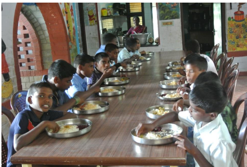
Pranzo nella Casa del Sorriso di Ananda Illam

preferenze. L'ultima parola spetta sempre al direttore della Casa, il quale si assicura che l'eventuale cambiamento non comprometta il valore nutritivo dei pasti.