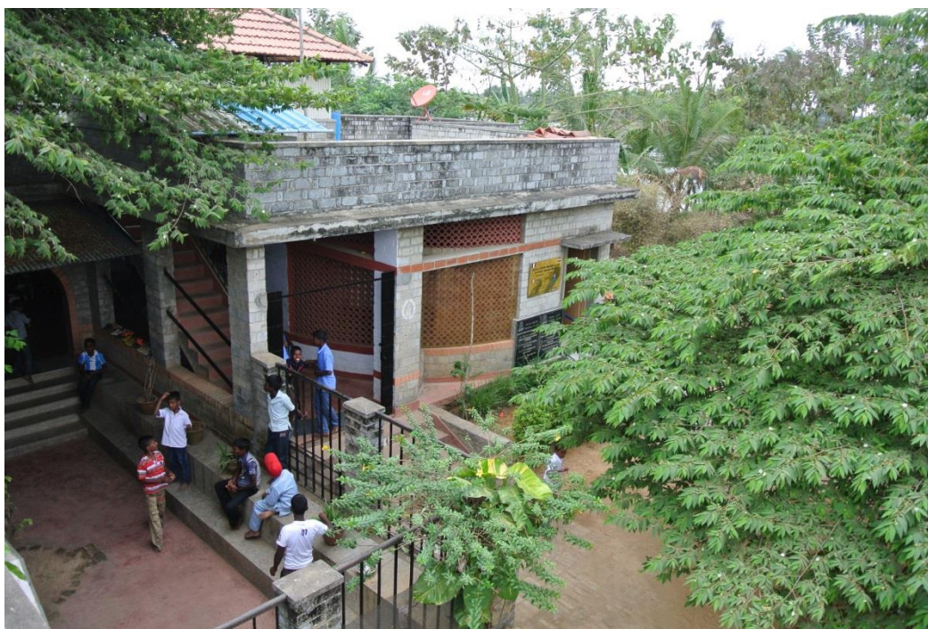
Veduta della Casa del Sorriso di Ananda Illam

JEEVA JOTHI è un'associazione fondata nel 1994 allo scopo di promuovere e proteggere i diritti delle persone povere del distretto di Thiruvallur , con un focus tematico collegato all' eliminazione del lavoro minorile . Jeeva Jothi si occupa della gestione della Casa del Sorriso Ananda Illam . L'associazione fornisce opportunità di istruzione a tutti i bambini che lavorano nei mulini di riso e nelle fabbriche di mattoni della zona, oltre all'assistenza nutrizionale e sanitaria .